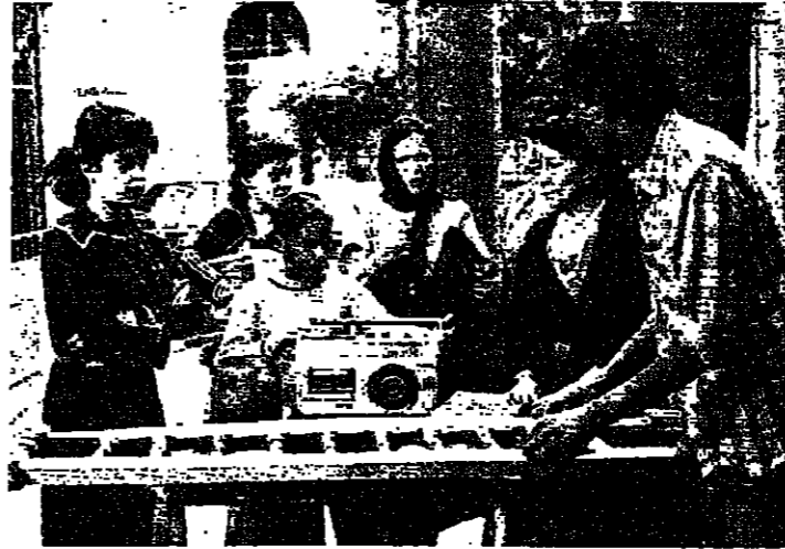
معلقة يوم من يوم حلو